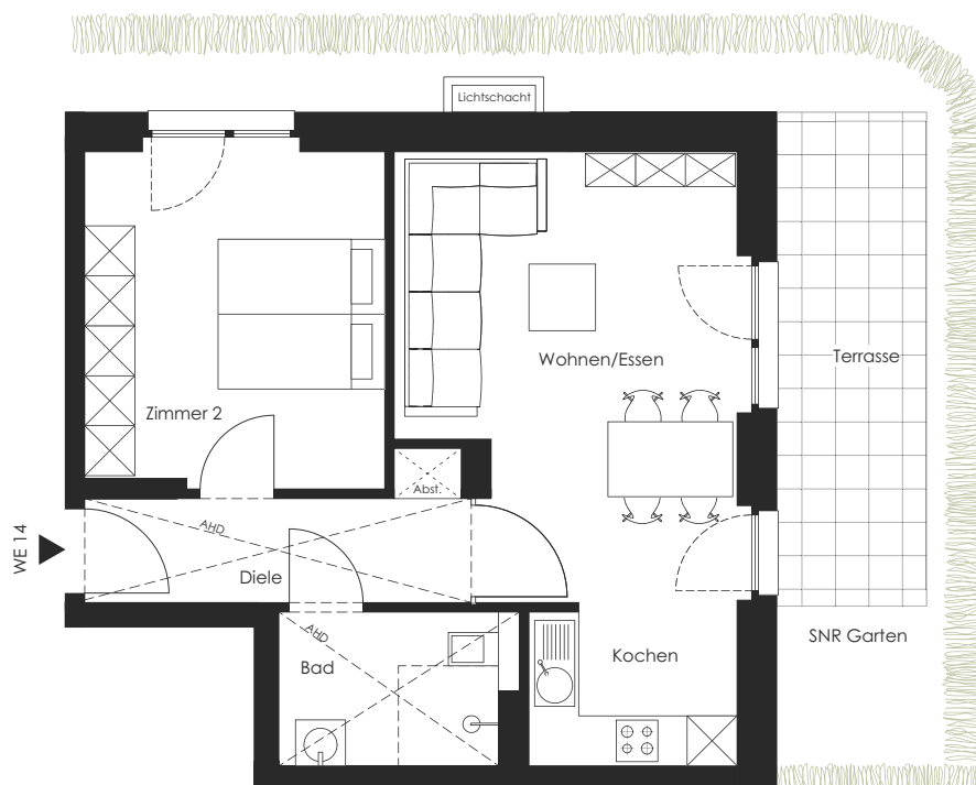
Ausschnitt M 1:500